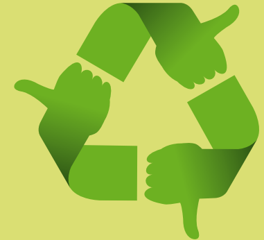
Etxeko hondakinen konposizioa

Bide onetik goaz! Jarrai dezagun hobetzen! ..... ¡Vamos por buen camino! ¡Sigamos mejorando!